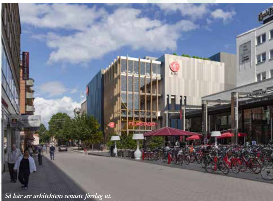
Så här ser arkitektens senaste förslag ut.

Intresset att hyra lokal hos oss på Uppsala Akademiförvaltning är stort från företag och organisationer. Kul tycker vi och hjälper gärna till att anpassa och ordna så lokalerna passar riktigt bra. Extra välkomna till våra nya hyresgäster: Folkvandvården, Imint, 1177, Företagarnas Revisionsbyrå, Connectel och Upplandsmuséets kontor. Se alla våra fastigheter och lediga lokaler på www.uaf.se